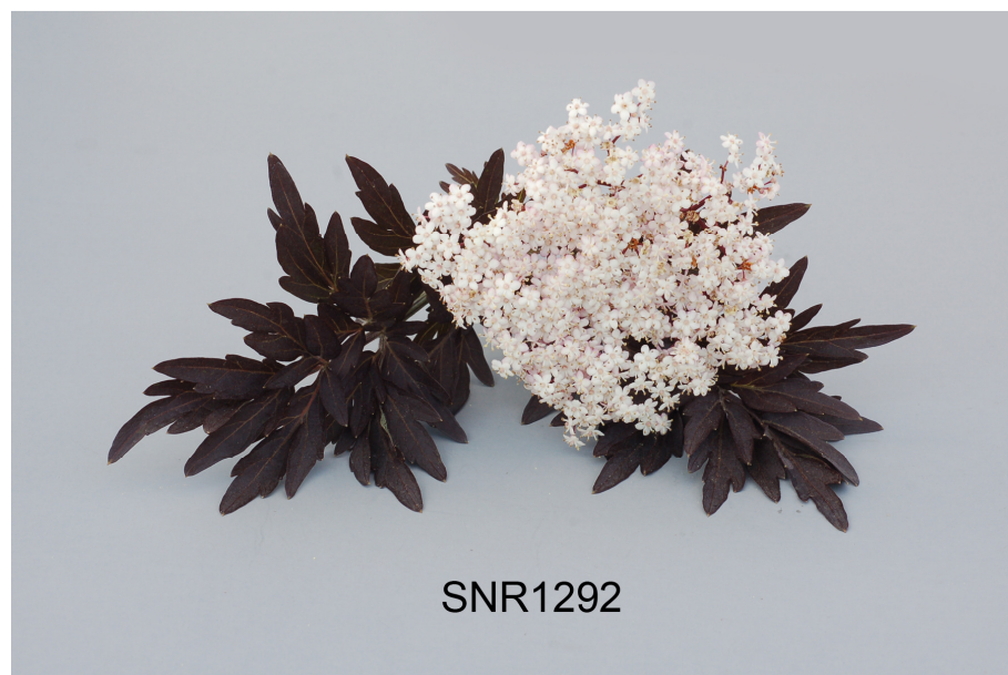
Sureau noir: 'SNR1292'