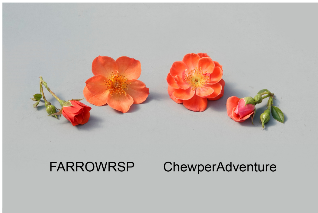
Rosier: 'FARROWRSP' (gauche) avec la variété de référence 'Chewperadventure' (droite)