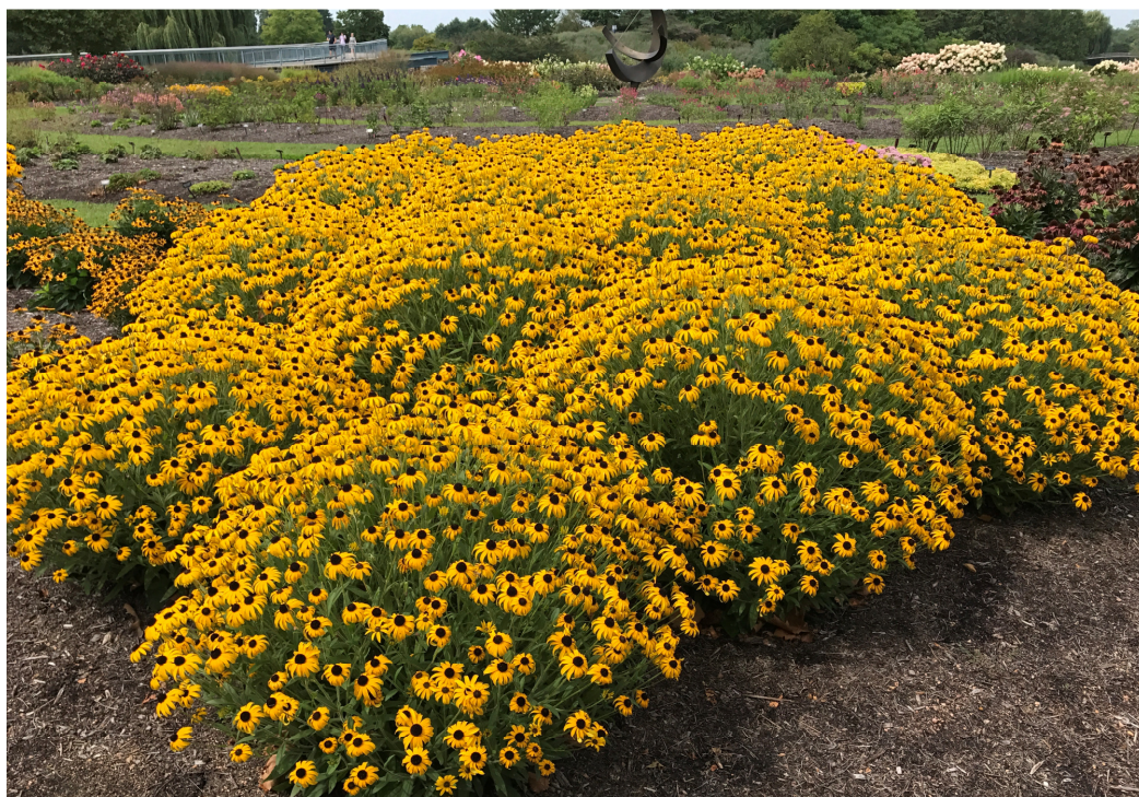
Rudbéckie de l'Ouest: 'American Gold Rush'